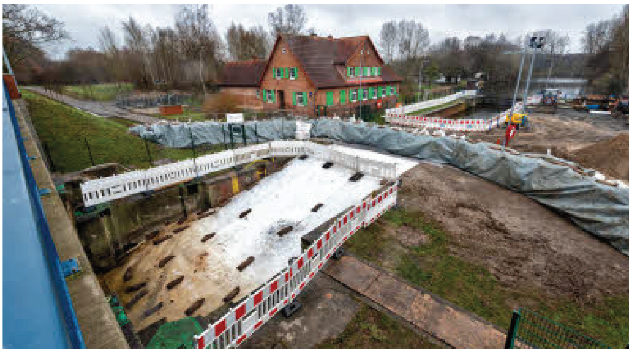
Die 1886 eröffnete Mühlenhammschleuse wurde freigelegt und mit Kies verfüllt. Sie ist seit 2015 offiziell als technisches Denkmal ausgewiesen.